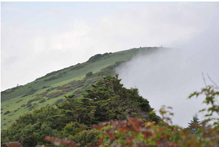
▲ ガスの切れ目に見える山頂