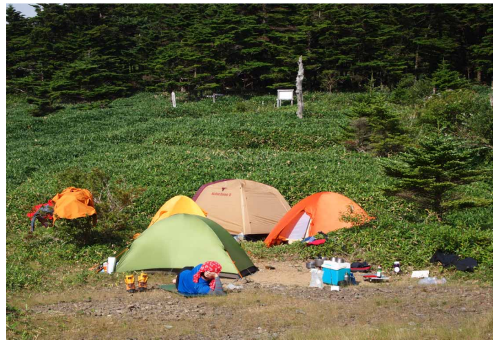
▲ キャンプ場での一枚