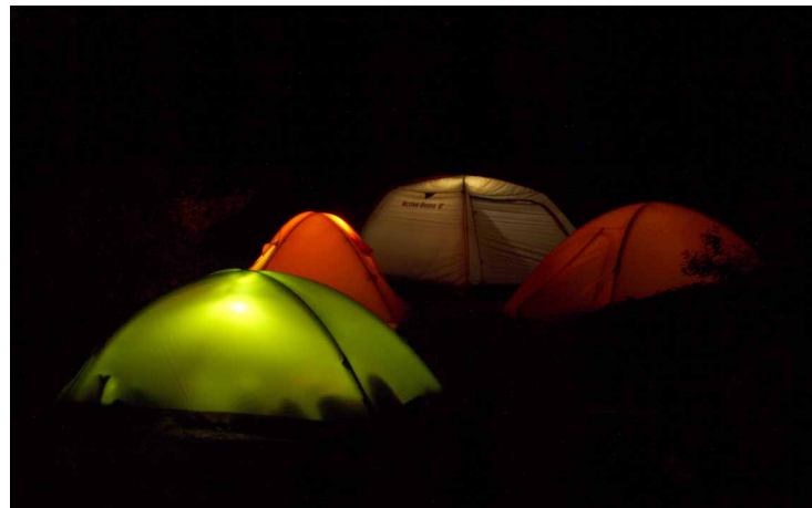
▲ 夜はテントのライトアップ

今回の山キャンプは、前回途中撤収の「瓶ヶ森」にリベンジしに行ってきました。勝手知ったる楽しい仲間と初キャン参加女子のワイワイ賑やかな瓶ヶ森周辺ハイキング&野外晚餐会と中々楽しい時間を過ごす事が出来ました！ただ一つの難点は《虫》でした、これさえ何とか出来れば最高なのにな～と思いました。