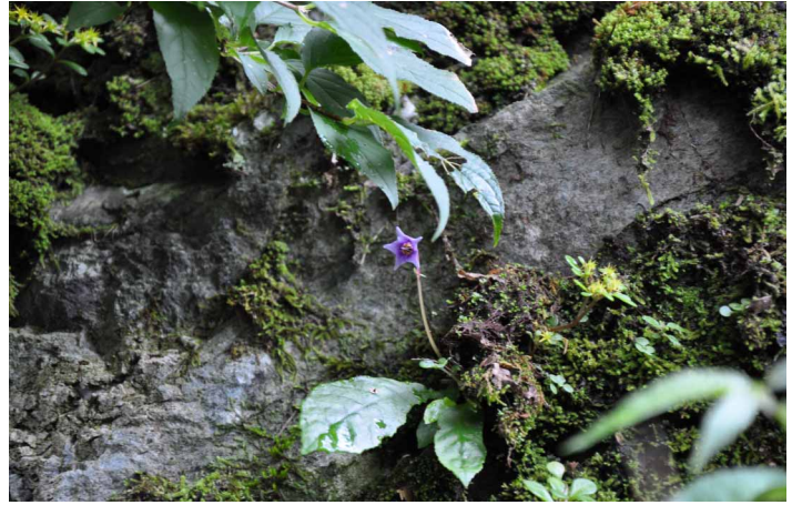
▲ 珍しいイワタバコの花